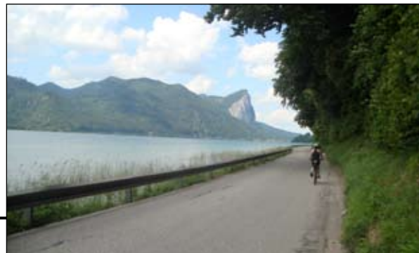
Jeden z mála úseků cyklotrasy, kdy se jede po „okrese“ s minimálním provozem ohleduplných řidičů. Po celou dobu jízdy se kocháme pohledem na dominantu jezera tzv. Dračí stěnu - Drächenwand (viz foto).