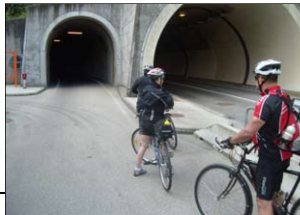
Hned na začátku cyklovýletu vás čeká místní atrakce jízda tunelem pro cyklisty.

POZOR! Je vhodné zapnout světlo a blikáčku. Osvětlení v tunelu je poměrně skromné.