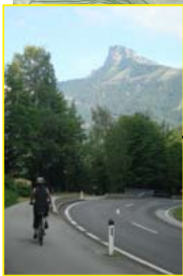
Závěrečný úsek po cyklostezce vedle rušné silnice. S výhledem na Dračí stěnu.