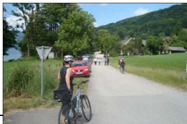
Vzorně upravené cyklostezky jsou samozřejmostí