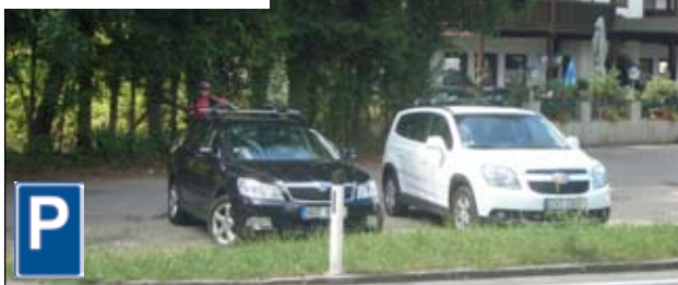
Hned po odbočení vlevo na křižovatce u jezera ze směru Wolfgangsee je po levé straně chata/hotel s menším parkovištěm (spíše položpevněným pláckem), doporučuji zaparkovat trochu stranou od hotelu (viz foto) aby jste nepřekáželi hostům, parkování zdarma.