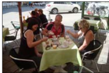
V městečku je bezpočet kavárenček nabízejících občerstvení