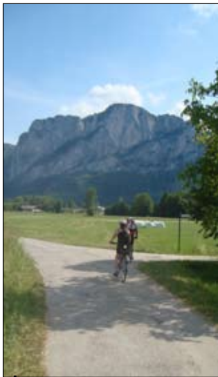
Pohled ze sedla kola na impozantní horské masivy v závěru cyklovýletu.

Jezero Mondsee vděčí svému názvu tvaru protáhlého půlměsíce vklíněného pod „strážní věž Solnohradská“ - Schafbergem. Jeho jihozápadní břeh tvoří hranici mezi Horním Rakouskem a Salzburskem. Hloubka je až 68 m. Mondsee je jedním z nejteplejších rakouských jezer - až 27°C