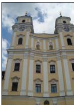
Město Mondsee na břehu stejnojmenného jezera. Místo bylo osídleno již v l. 2500 př. n.l. Je zde řada historických domů a památek. V místním skanzenu se jsou desítky lidových staveb. Jezero lemují čisté, udržované pláže