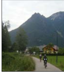
Míříme mezi alpské velikány, po příjemné rovině