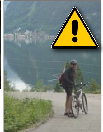
Při sjezdu zpět k jezeru se nenechte strhnout k rychlé jízdě. Na fotografii je jedno z nebezpečných míst - levotočivá zatáčka bez ohrazení. Vyjetí z cyklostezky by mělo fatální následky.