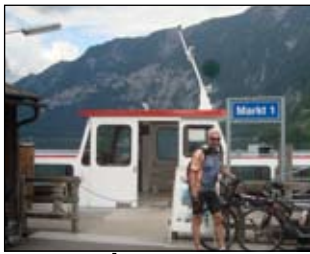
Vzhledem k tomu že přívoz je jedinou spojnici mezi městečkem a železniční stanicí, doporučujeme být v přístavu s dostatečným předstihem. Hrozí nebezpečí že se s koly na palubu nedostanete. Pokud by to byl poslední spoj určitě by to nebylo příjemné.