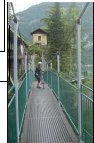
Úsek jízdy po zavěšené lávce nad jezerem je příjemné zpestření cesty

Městečko Hallstatt: Tato malebná rakouská obec se nachází ve výšce 508 metrů nad mořem, v blízkosti Halstatského jezera, které společně s pohořím Dachsteinem a Solnou komorou náleží ke Světovému dědictví UNESCO. Ještě na konci 19. století do Hallstattu nedalo dostat jinak než lodí (některé z domů jsou postaveny na kulech a zapuštěny do jezera) nebo úzkou horskou stezkou. Doporučujeme zamknout kola do stojanů v přístavu a pěšky se vydat do horních partií městečka. Odtud jsou nezapomenutelné výhledy na jezero.