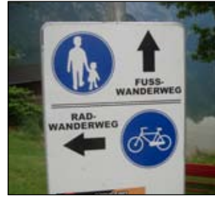
V těchto místech opouštíme pohodlnou cyklotrasu a musíme překonat skalní masiv.