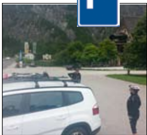
Parkování na velké odstavné ploše u místního hotýlku zdarma.